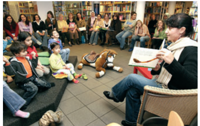
Lies mir vor - jetzt gleich! Die mehrsprachigen Vorlesepatinnen des Programms K.I.M. begeistern ihre kleinen und großen Zuhörerinnen und Zuhörer in der Bücherei Kamen.

Die geschilderten Aktivitäten haben inzwischen Kreise gezogen – der Austausch zwischen zugewanderten und einheimischen Familien ist neu in Bewegung gekommen. Begegnungen zwischen Frauen und ihren Kindern außerhalb des durch das Programm vorgegebenen Rahmens sind heute selbstverständlich geworden. Die Zuwanderinnen sind nicht nur zunehmend verstärkt im gesellschaftlichen Leben, sondern auch bei öffentlichen Diskussionsveranstaltungen zu Frauenfragen präsent. Die Frauen von K.I.M. sind Multiplikatorinnen. Sie tragen ihre Idee von der Verständigung zwischen den Kulturen zu anderen Frauen, zu ihren Kindern, zu fremden Menschen deutscher und anderer Kultur. Damit ist K.I.M. im Kreis Unna ein Baustein für eine integrative Welt.